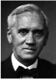
Sir Alexander Fleming