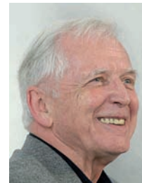
Harald Zur Hausen

El professor Harald zur Hausen, va rebre el 2008 el Premi Nobel de Medicina pels estudis sobre el Virus del papil·loma humà en el càncer de coll uterí. Zur Hausen va néixer l'any 1936 i va estudiar Medicina a les universitats de Bonn, Hamburg i Düsseldorf on es va graduar. L'any 1960 es va doctorar i va ser post-doctoral a