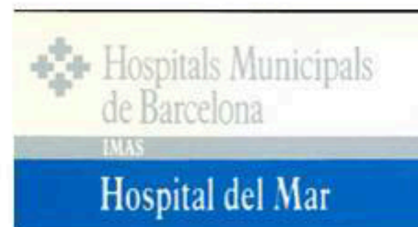
Logotip vigent any 1992