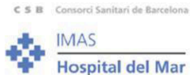
Logotip any 1997