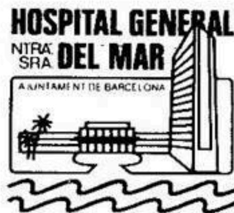
Imatge utilitzada al butlletí d'infermeria, any 1983